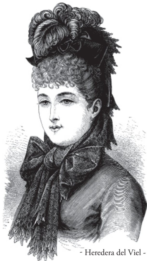
- Herederas del Viel -